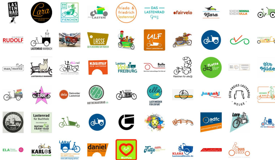
Logos der Initiativen "Freie Lastenräder"

Zusätzlich wird über das Stationskonzept nachbarschaftliches Miteinander gefördert: die Entleihe und Rückgabe erfolgt nicht anonym, sondern wechselt zwischen Cafés, Bürgerzentren, Privatpersonen und sozialen Einrichtungen.