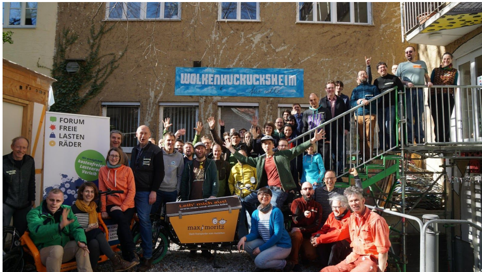
Netzwerk-Treffen Forum Freie Lastenräder 2019 in Augsburg.