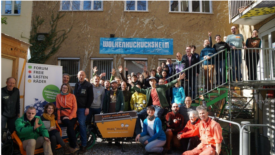
Netzwerk-Treffen Forum Freie Lastenräder 2019 in Augsburg.